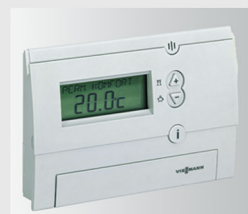
Vitotrol 100, устройство дистанционного управления для управления по температуре помещения