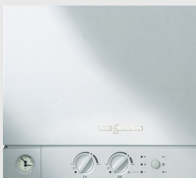
Контроллер для управления по постоянной температуре подачи