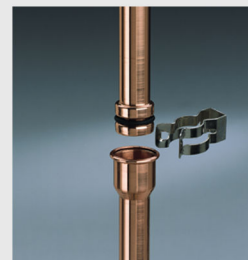
Быстроразъемные гидравлические соединения Multi-Stecksystem