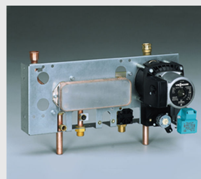
Aqua-Platine - гидравлический блок с циркуляционным насосом и проточным теплообменником