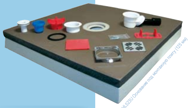
HL523U Основание под монтажную плиту (125 мм)

Монтажная плита 90 x 90 см, 120 x 120 см