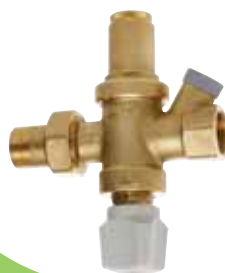
Арт. 250 Подпиточный клапан. С отсекающим краном и фильтром. В комплекте с обратным клапаном. Боковые подключения к манометру: 1/4 газ. Максимальное давление: на входе - 10 бар на выходе - 3 бар. Фабричная настройка: 1,5 бар.