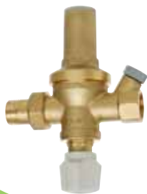
Арт. 249 Подпиточный клапан. С отсекающим краном и фильтром. В комплекте с обратным клапаном. Боковые подключения к манометру: 1/4 газ. Максимальное давление: на входе - 16 бар на выходе - 6 бар. Фабричная настройка: 1,5 бар.