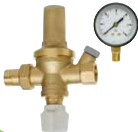
Арт. 249 + 243 Подпиточный клапан. С отсекающим краном и фильтром. В комплекте с обратным клапаном и манометром. Боковые подключения к манометру: 1/4 газ. Максимальное давление: на входе - 16 бар на выходе - 6 бар. Фабричная настройка: 1,5 бар.