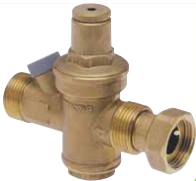
Арт. 260 Редуктор давления.