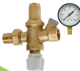
Арт. 250 + 244 Подпиточный клапан. С отсекающим краном и фильтром. В комплекте с обратным клапаном и манометром. Боковые подключения к манометру: 1/4 газ. Максимальное давление: на входе - 10 бар на выходе - 3 бар. Фабричная настройка: 1,5 бар.